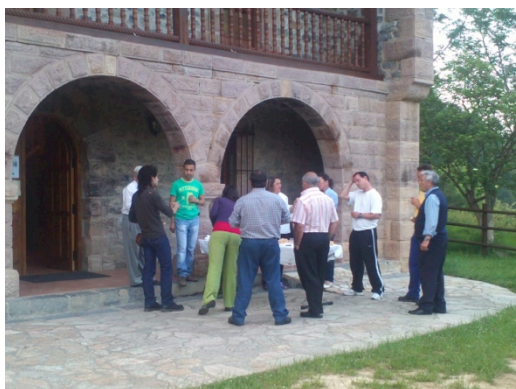
Taller Diseño Líneas de Acción, Cantabria

En el caso de Cantabria, se llegó al compromiso por parte de los ganaderos de formar un grupo de trabajo que continuará, a partir del próximo mes de Septiembre, con las tareas ya iniciadas.