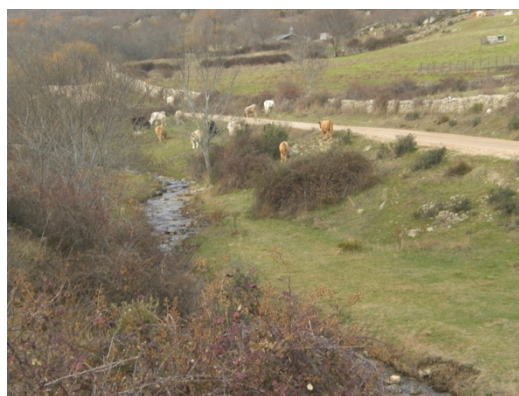
Transecto en El Boalo, Madrid