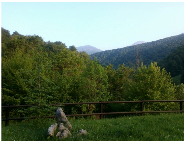
Saja, Cantabria