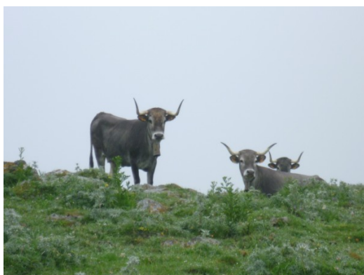
Ganado de Quijas, Cantabria

OBSERVATORIO PARA UNA CULTURA DEL TERRITORIO. G 85:809.408