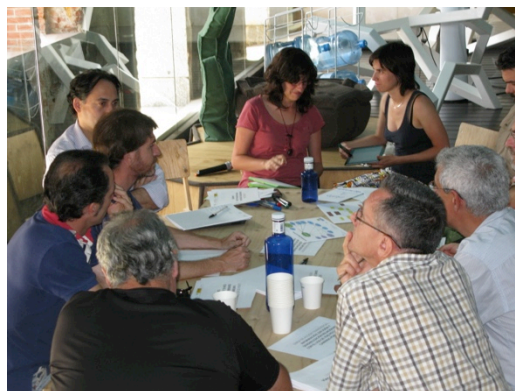
Taller Viabilidad Líneas de Acción, Madrid