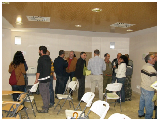
Taller Diseño Líneas de Acción, Madrid