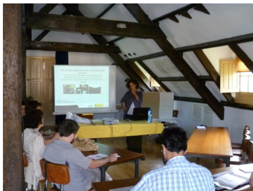
Taller Viabilidad Líneas de Acción, Cantabria

En el taller celebrado en Cantabria dos días después, el 5 de Julio, ha habido 9 participantes, entre agentes de las administraciones locales y regionales, sindicatos y asociaciones relacionadas con los movimientos de ganado. En este caso se comprometieron miembros de estos organismos a apoyar en la continuación de las tareas ya iniciadas al grupo de trabajo de ganaderos formado en el taller anterior.