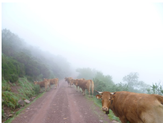
Transecto en Ormas, Cantabria